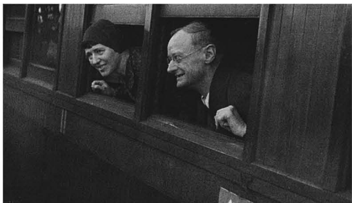
高崎を去る日、高崎駅にて