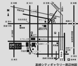
高崎シティギャラリー周辺地図

2011年3月7日（月）までに、①お名前、②所属、③住所、④電話番号、⑤FAX 番号または E-mail アドレス、を明記のうえ、E-mail または FAX にて「講演会申込み」の件名とともに下記申込み先までお申し込みください。なお、申込みが定員に達した場合のみ、お断りのご連絡をいたします。