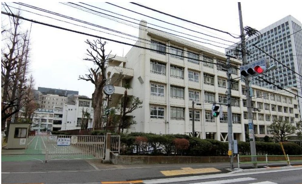
東京都立三田高等学校（右）、港区立赤羽小学校（左奥）