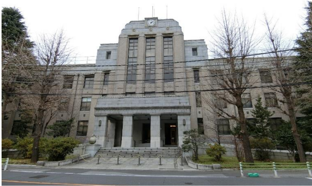
旧東京簡易保険支局（かんぽ生命保険 東京サービスセンター）正面