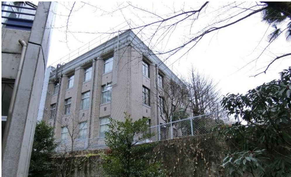
旧東京簡易保険支局（かんぽ生命保険 東京サービスセンター）背面